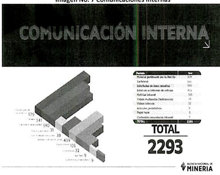
Imagen No. 7 Comunicaciones Internas