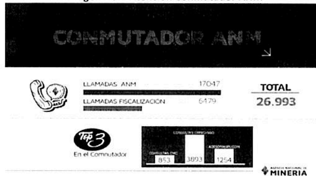
Imagen No.4 Atención Conmutador ANM