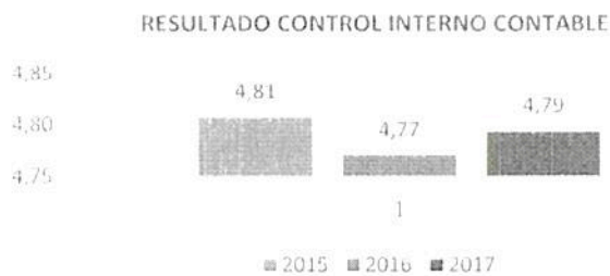
Gráfica No. 1 Comparativo Control Interno Contable

Al comparar el resultado 2017, con las vigencias 2015 y 2016, se evidencia un repunte en la calificación de la evaluación equivalente a 0,02 puntos respecto a la vigencia inmediatamente anterior y una recuperación en la misma proporción comparados con el 2015. Esto indica estabilidad en la gestión del control interno contable - CIC - de la Entidad.