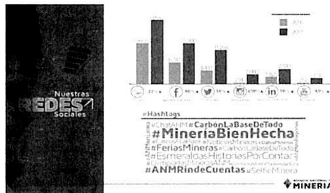
Imagen No. 6 Gestión en Redes Sociales