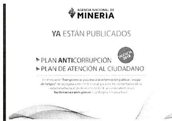
Imagén No. 1 Invitación a Comentarios Plan Anticorrupción y Atención al Ciudadano

El Plan Anticorrupción y de Atención al ciudadano, fue publicado de manera oportuna y se encuentra en el link