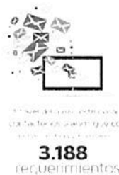
Imagen No.5 Atención Correo Electrónico