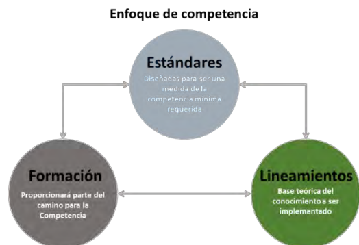
Figura 2. (Enfoque de competencias)

Este complejo sistema se puede mirar en términos de reacciones en cadena en las cuales un cambio en una condición normalmente puede tener un efecto dominó múltiple. Afortunadamente, las minas subterráneas usualmente se encuentran bajo auditoría continua para minimizar los peligros y mitigar riesgos. Las evaluaciones de riesgo son otra herramienta fundamental para identificar peligros y reducir los riesgos. Debido a esas difíciles condiciones, operadores de minas,